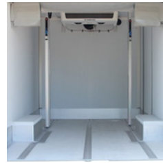
Flüssigkeitsdichte Bodenwanne aus Aluminium-Gerstenkorn