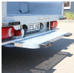
bequemer breiter Aufstiegstritt