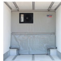
Cool Flap® Trennwand verschiebbar und hochklappbar