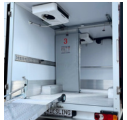
Eco Speeder als Mehrkammerfahrzeug mit zwei Verdampfern.