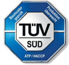
Für HACCP-geprüft - hygienisch sicherer Transport