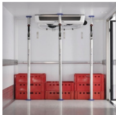
Ladungssicherung: Klemmbalken zwischen Boden und Decke gespannt