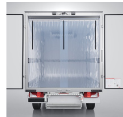
PVC-Kältevorhang, zweigeteilt, verschiebbar