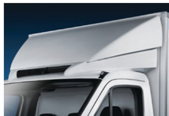
für Cooler Flitzer®: