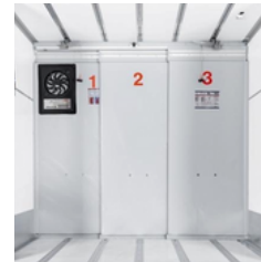
Cool Slide® Trennwand für Transporte in mehreren Temperaturbereichen