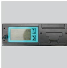
Temperaturschreiber mit Drucker