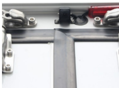
Rückfahrkamera: Sicherheit beim Rangieren