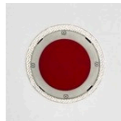
Notentriegelung, Türe kann von innen geöffnet werden