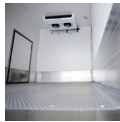
flüssigkeitsdichte Bodenwanne aus Aluminium-Gerstenkorn