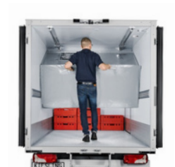
Cool Flap® leichte Trennwand, wird bei Nichtgebrauch zur Decke hochgeklappt