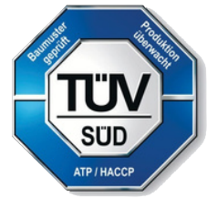
für HACCP-geprüft - hygienisch sicherer Transport