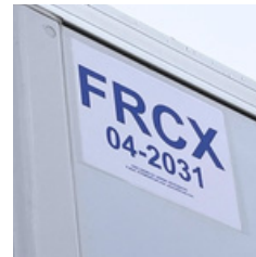
ATP-FRC - Zertifikat und Beschriftung