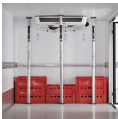
Ladungssicherung: Klemmbalken zwischen Boden und Decke gespannt