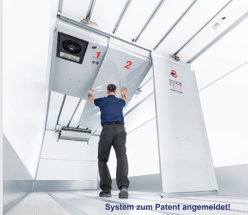
System zum Patent angemeldet!