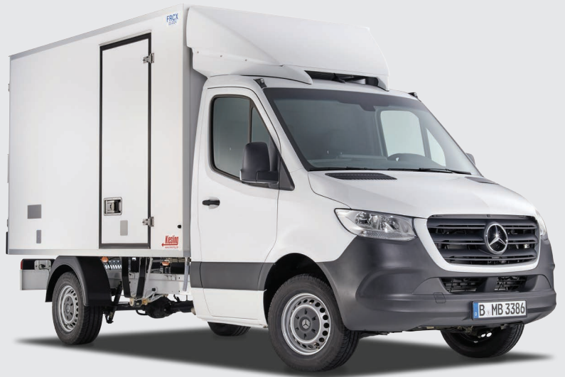
Abbildung Cooler Flitzer mit Option Aero Paket