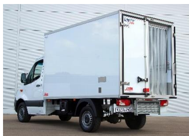
Heckansicht mit Kältevorhang und klappbarem Aufstiegstritt