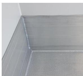
stabile, flüssigkeitsdichte Bodenwanne aus Alu- Gerstenkorn (HACCP)

Kühlaggregat: Thermo King V 500-50 max Fahrt- und Standbetrieb bis -18°C, 15 m Kabel für Standkühlung Heizbetrieb, Temperaturlaufzeichnung