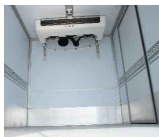
Innenansicht mit Ankerschiene