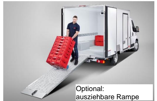
Optional: ausziehbare Rampe