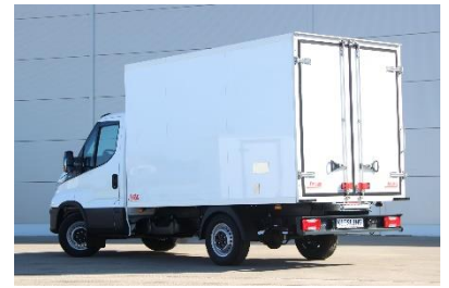
Seitentür rechts, 900 mm breit