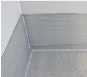
stabile, flüssigkeitsdichte Bodenwanne aus Alu-Gerstenkorn (nach HACCP geprüft)