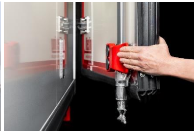
Easy Lock, magnetische Türfeststeller an den Hecktüren