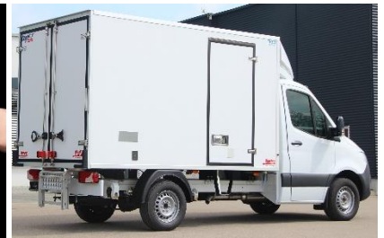
Seitentür rechts, 900 mm breit