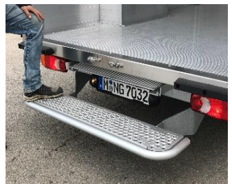
Optional: breiter Aufstiegstritt