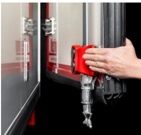
Easy Lock, magnetische Türfeststeller an den Hecktüren