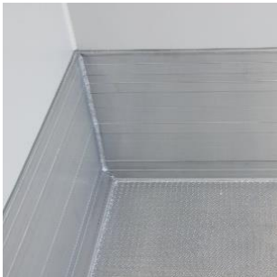
Stabile, flüssigkeitsdichte Bodenwanne aus Alu-Gerstenkorn