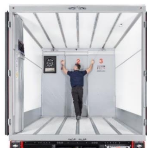
Cool Slide Trennwand,