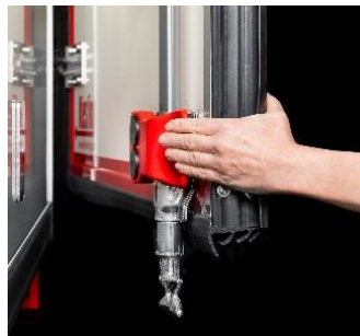
Easy Lock, magnetische Türfeststeller an den Hecktüren