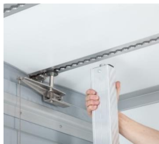
Lochschiene Decke vollversenkt als Laufschiene für Trennwand